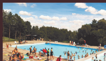
basen letni z brodzikiem